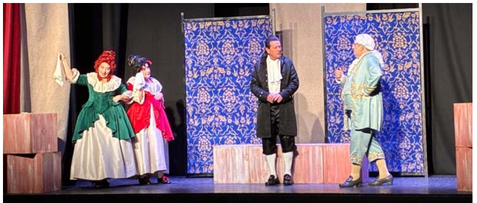
De dalt a baix: 12 sense pietat d'ACR de Fals, Adossats del Grup de Teatre l'Ull de bou i l'Hostalera de Génesis Teatro.