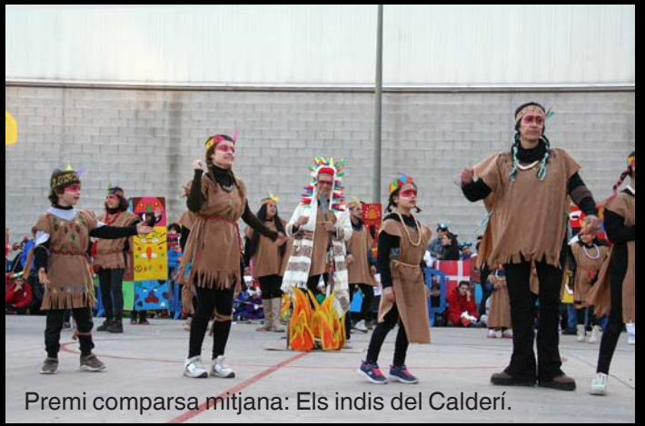
Premi comparsa mitjana: Els indis del Calderí.