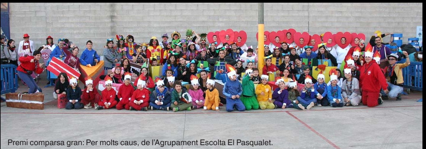
Premi comparsa gran: Per molts caus, de l'Agrupament Escolta El Pasqualet.