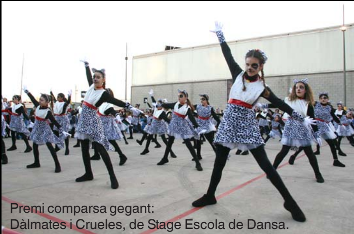
Premi comparsa gegant: Dàlmates i Cruelles, de Stage Escola de Dansa.