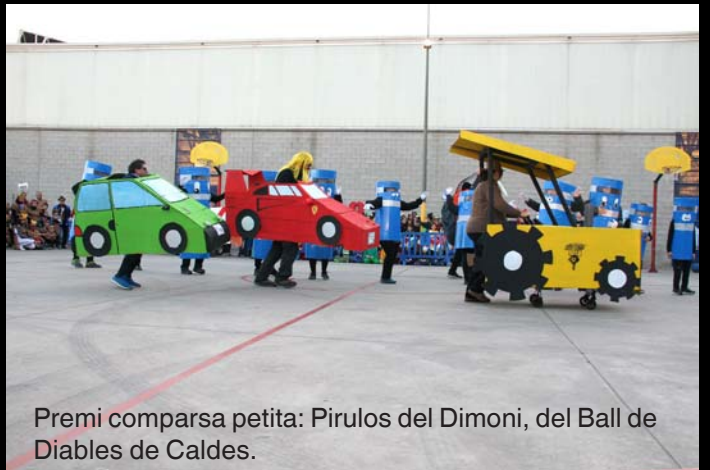
Premi comparsa petita: Pirulos del Dimoni, del Ball de Diablers de Caldes.