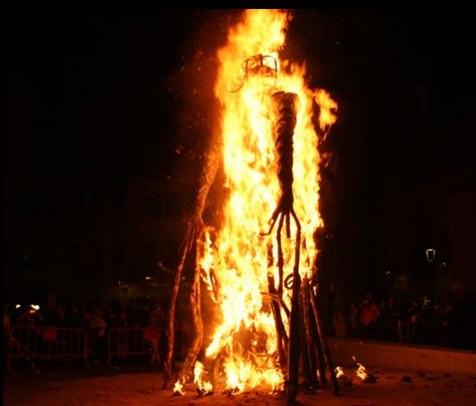
Crema del Ninot de Carnestoltes per part del Ball de Diables de Caldes.